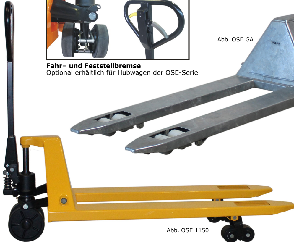
Abb. OSE GA